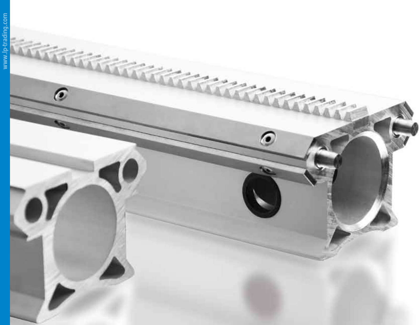
VOM PROFIL ZUR BAUGRUPPE