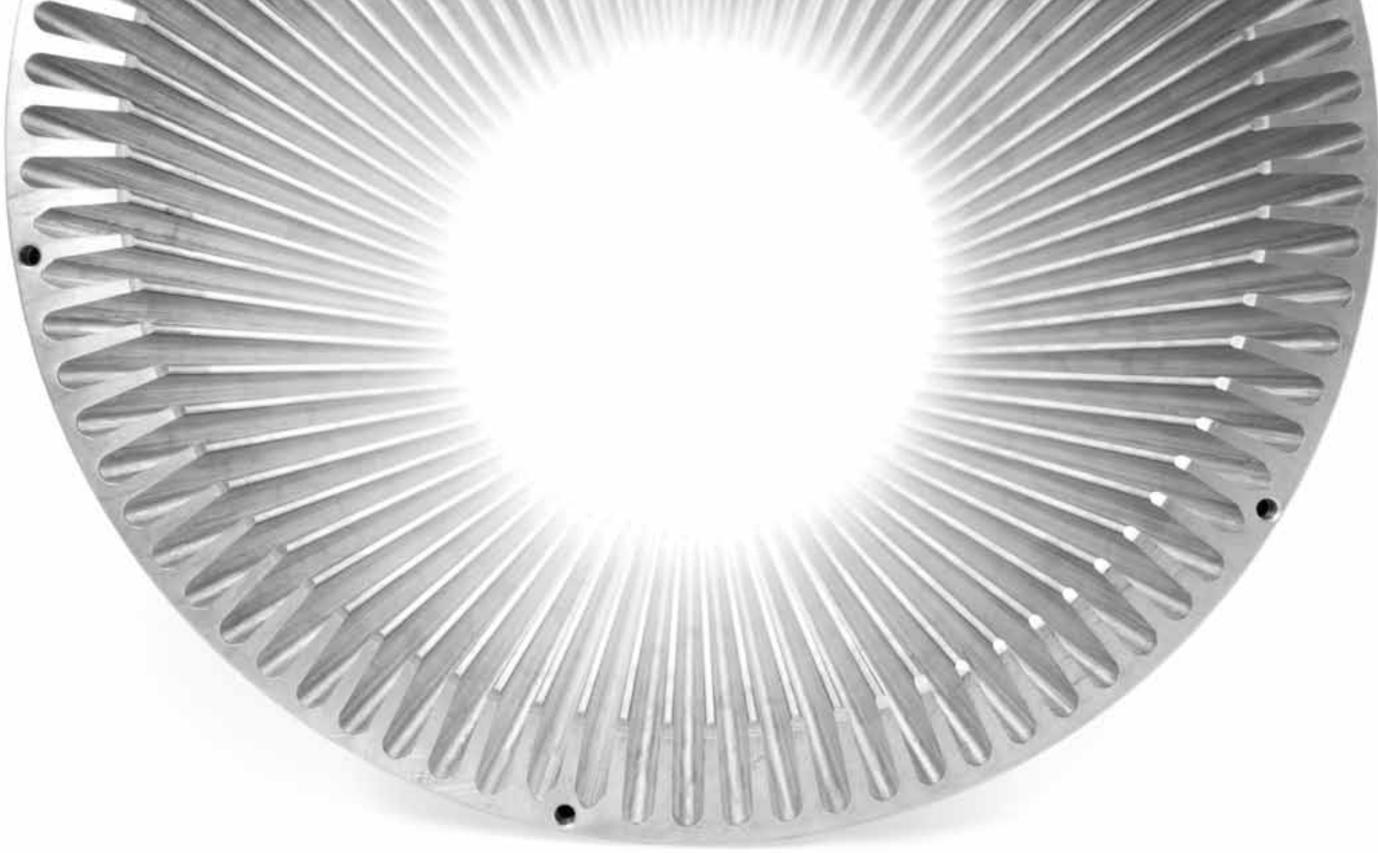
BIS 30 KG/LFM